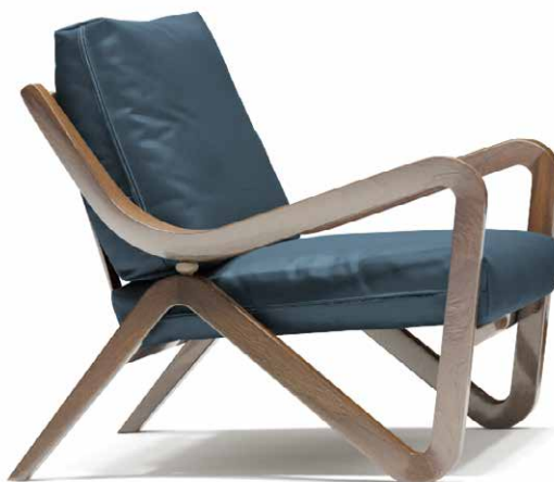
armchair 68x88 h 82 / Leather art. SEQUOIA col. 4020. Detail Gros-grain col. 4527. Solid Canaletto walnut wooden frame.

Structure : bois massif. Suspension d'assise : sangles  lastiques. Rembourrage : coussin d'assise amovible en mousse polyur thane densit  35 Kg/m 3 couvert par un couette en duvet   secteurs pour garantir au duvet une localisation nette et constante dans le temps. Coussin dossier en duvet   secteurs pour conf rer douceur et souplesse. D tail : carcasse en bois massif sculpt e   la main. Marque « B » en laiton laqu e incrust e dans la carcasse en bois. Structure ext rieure : en bois de ch ne laqu e ou noyer Canaletto massif, faite par des ma tres artisans avec greffes structurelles solides d'estimable manufacture.