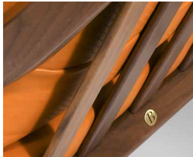
marchio B in ottone logo B in brass logo B en laiton