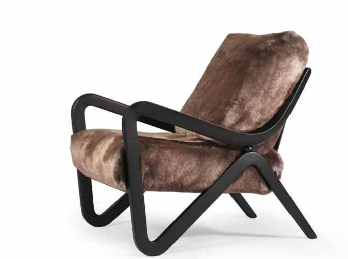
armchair 68x88 h 82 / Synthetic fur art. BLUE FOX Z339 col. 01. Solid Oak wooden frame Black Oak.