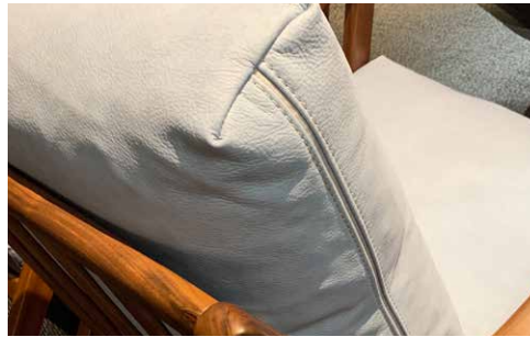
nastro in Gros-grain Gros-grain ribbon ruban Gros-grain