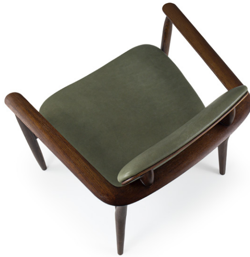
armchair 75x62 h 71 / Leather art. WATERFALL col. 41. Solid Oak wooden frame col. Light Brown.