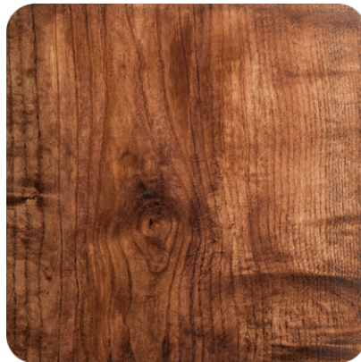
CHALK BROWN OAK (LA1)