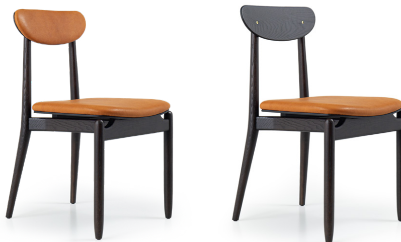
chair 48x55 h 84

Structure : bois massif. Rembourrage : coussin d'assise et dossier fixe en mousse polyuréthane densité 40Kg/m 3 . Détail : carcasse en bois massif sculpté à la main. Structure extérieure : en bois de chêne laqué ou noyer Canaletto massif, faite par des maîtres artisans avec greffes structurelles solides d'estimable manufacture.