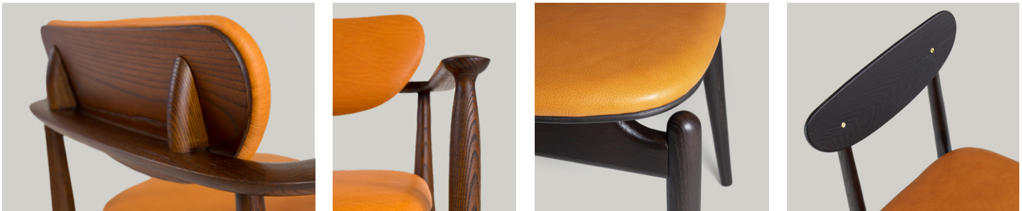
struttura in legno massello scolpito a mano solid wood frame hand carved carcasse en bois massif sculpté à la main