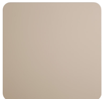
LACQUERED RAL CODE (LA1)

Tutte le immagini sono inserite a scopo illustrativo, i colori sono puramente indicativi e possono differire dai toni reali. All images are shown for illustrative purposes, the colors are purely indicative and may differ from the real tones. Toutes les images sont présentées à titre d'illustration, les couleurs vues sur l'écran sont purement indicatives et peuvent différer des tons réels.