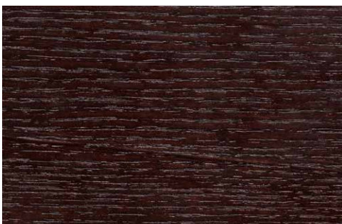
BROWN OAK (LA1)