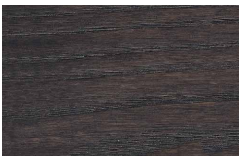
GREY OAK (LA1)