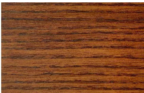
LIGHT BROWN OAK (LA1)