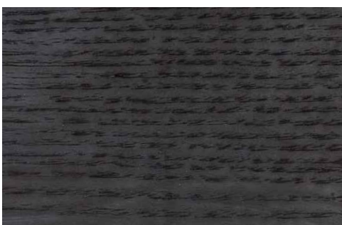
BLACK OAK (LA1)