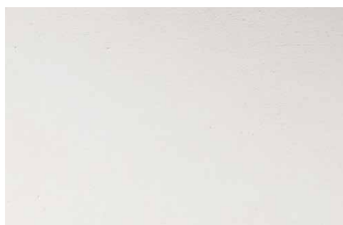
LACQUERED RAL CODE (LA1)

Tutte le immagini sono inserite a scopo illustrativo, i colori sono puramente indicativi e possono differire dai toni reali. All images are shown for illustrative purposes, the colors are purely indicative and may differ from the real tones. Toutes les images sont présentées à titre d'illustration, les couleurs vues sur l'écran sont purement indicatives et peuvent différer des tons réels.