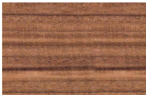
CANALETTO WALNUT (LA2)