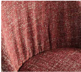
drappeggio drapery drapé