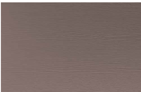
DARK CASHMERE OAK (LA1)