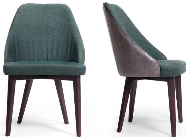
chair 55x59 h 87 / Outside-frame leather art. GHOST col. 35. Inside-frame and seat fabric art. ASOLO L1569 col. 12. Lacquered Brown Oak wooden base.

Structure : en contreplaqué de bouleau. Suspension d'assise : panneau en bois perforé. Rembourrage : coussins d'assise fixe en mousse polyuréthane densité 40Kg/m 3 garni avec fibre polyester ; structure rembourrée en mousse polyuréthane densité 40kg/m 3 . Base: en bois de chêne naturel ou traité en différentes couleurs, pieds avec des patins en plastique appropriés. Base disponible en deux versions différentes: "R" ou "X".