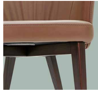
base in legno "R" "R" wooden base base en bois "R"