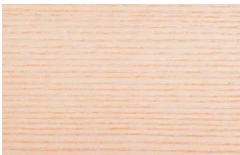
NATURAL OAK (LA1)