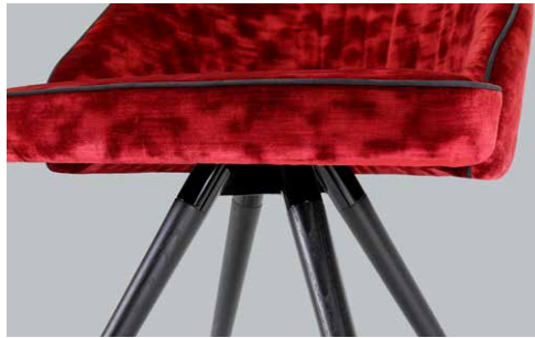
base in legno "X" "X" wooden base base en bois "X"