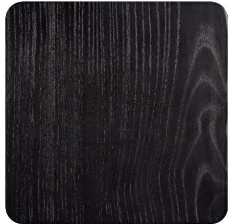
GREY OAK (LA1)