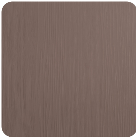
DARK CASHMERE OAK (LA1)