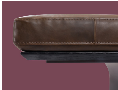
base in legno wooden base base en bois