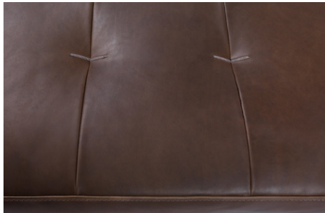
cucitura a Zig-Zag compatto compact Zig-Zag stitching couture Zig-Zag compacte