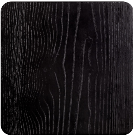
BLACK OAK (LA1)