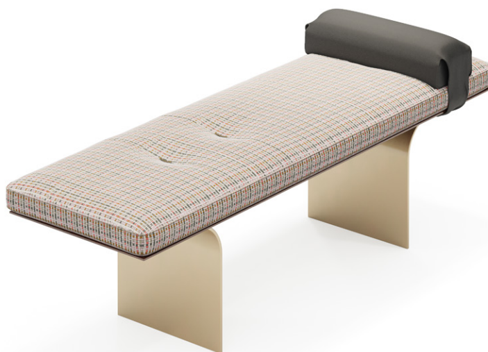
bench 150x45 h 46 / Seat fabric art. KUBOA 9072 col. 04. Arm leather art. SEQUOIA col. 4027. Under seat lacquered Light brown oak wood. Metal feet finish col. YY276I Beige.

Structure : placage en hêtre laqué ou noyer Canaletto. Rembourrages : siège fixe en polyuréthane expansé d'une densité de 40 kg/m 3 et bombage d'une densité de 25 kg/m 3 . Détail : double étirage au niveau de l'assise mis en évidence par des coutures en zigzag compact. Pieds : en métal laqué ou galvanisé.