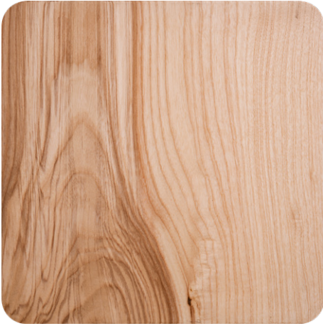
NATURAL OAK (LA1)