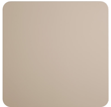
LACQUERED RAL CODE (LA1)

Tutte le immagini sono inserite a scopo illustrativo, i colori sono puramente indicativi e possono differire dai toni reali. All images are shown for illustrative purposes, the colors are purely indicative and may differ from the real tones. Toutes les images sont présentées à titre d'illustration, les couleurs vues sur l'écran sont purement indicatives et peuvent différer des tons réels.