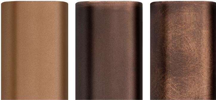
DELABRÉ ORO V1 *

LACCATO OPACO ASPORTATO A MANO / HAND-REMOVED MATT LACQUERED / LAQUÉ MAT BROSSÉ À LA MAIN