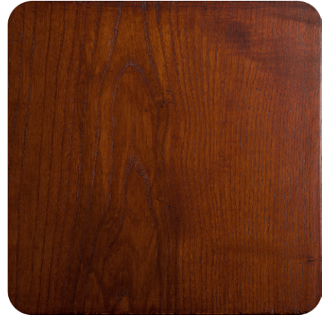
LIGHT BROWN OAK (LA1)