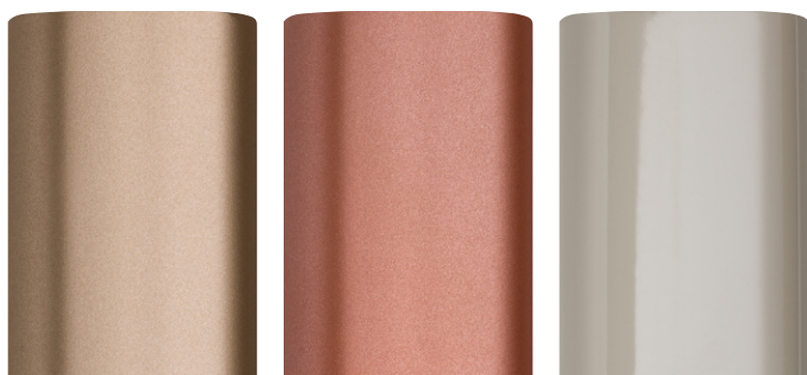
SAND GOLD *