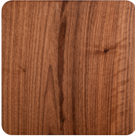
CANALETTO WALNUT (LA2)