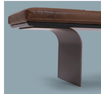
piedi in metallo metal feet pieds en métal