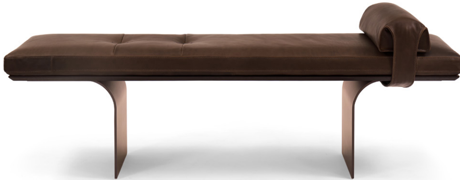
bench 150x45 h 46 / Seat+arm leather art. TUSCANIA col. 24. Under seat lacquered Black oak wood. Metal feet finish col. Vulcan Grey.