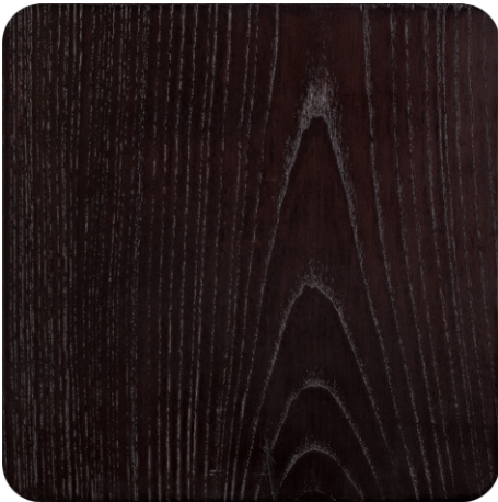
BROWN OAK (LA1)