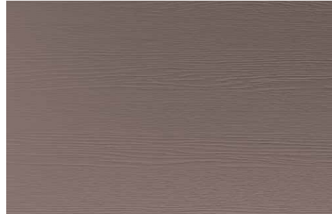
DARK CASHMERE OAK (LA1)