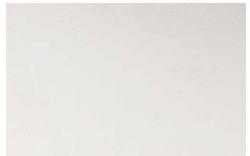
LACQUERED RAL CODE (LA1)

Tutte le immagini sono inserite a scopo illustrativo, i colori sono puramente indicativi e possono differire dai toni reali. All images are shown for illustrative purposes, the colors are purely indicative and may differ from the real tones. Toutes les images sont présentées à titre d'illustration, les couleurs vues sur l'écran sont purement indicatives et peuvent différer des tons réels.