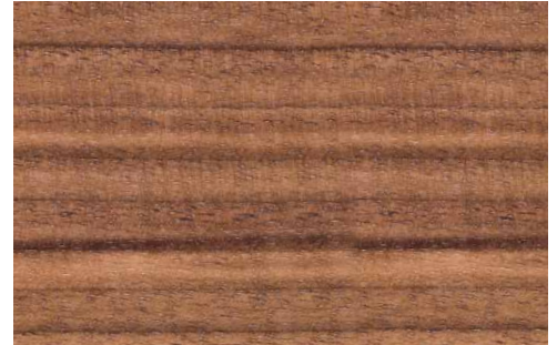
CANALETTO WALNUT (LA2)