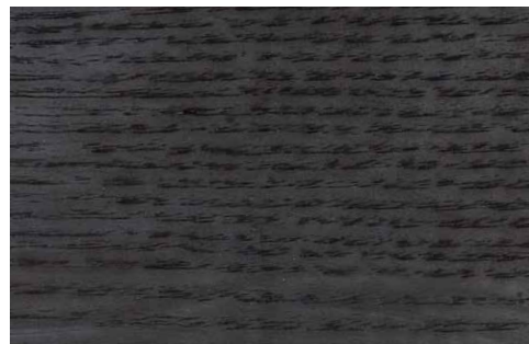
BLACK OAK (LA1)