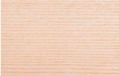
NATURAL OAK (LA1)